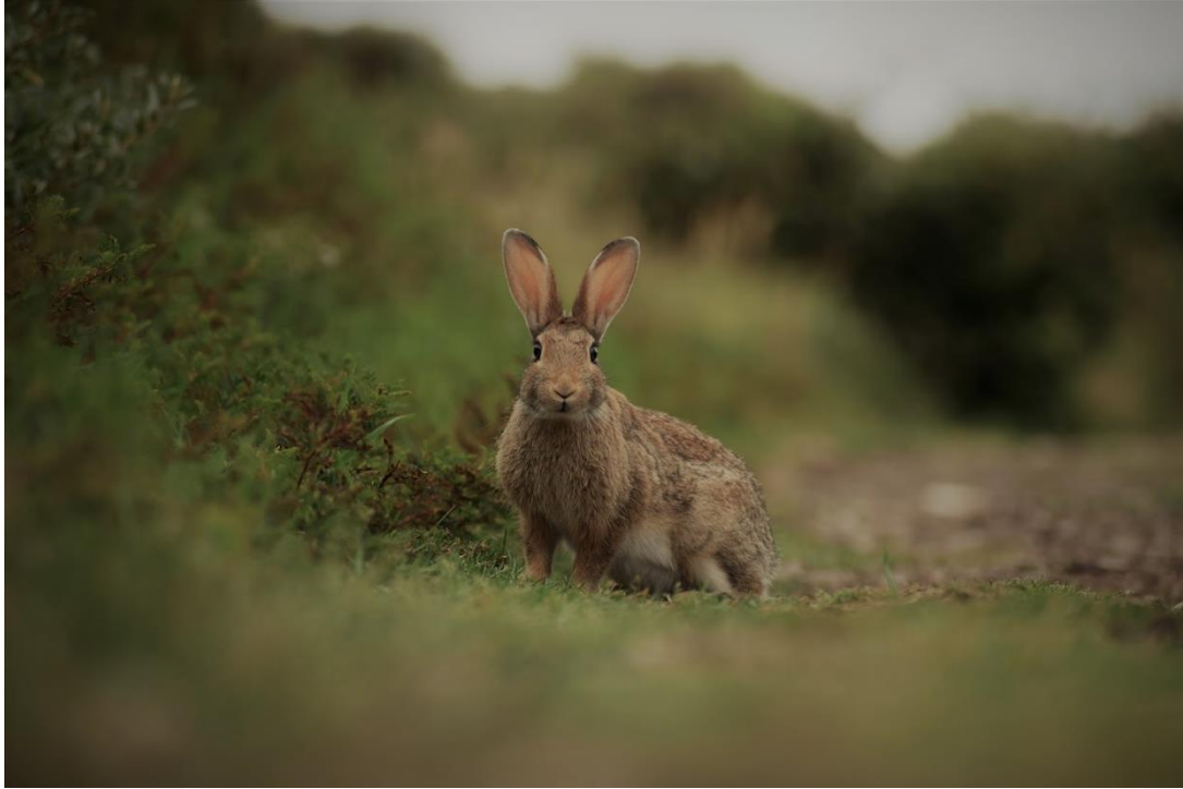
1. Duinkonijn. Gemaakt in de duinen nabij Paal 17 op Texel.