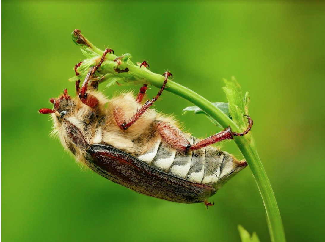
5. Bosmeikever aan het chillen na een kleine regenbui.