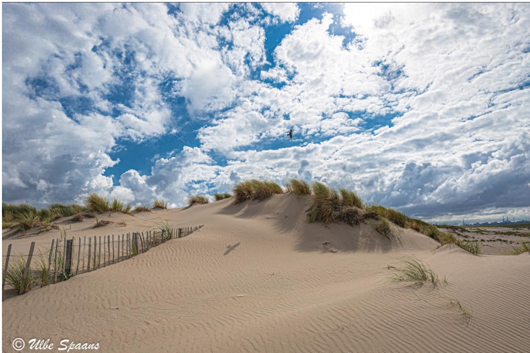
2. Slag Beukel in Westland. Zandpatronen en een karakteristieke lucht. De vogel projecteert haar schaduw op het zand.